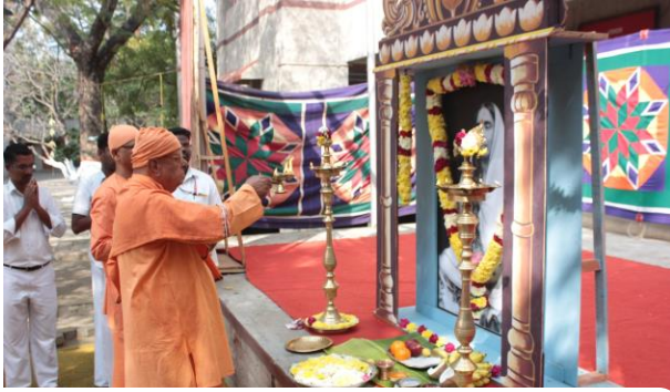
Swami Swami Tanmayanandaji Maharaj Inaugurating Pongal