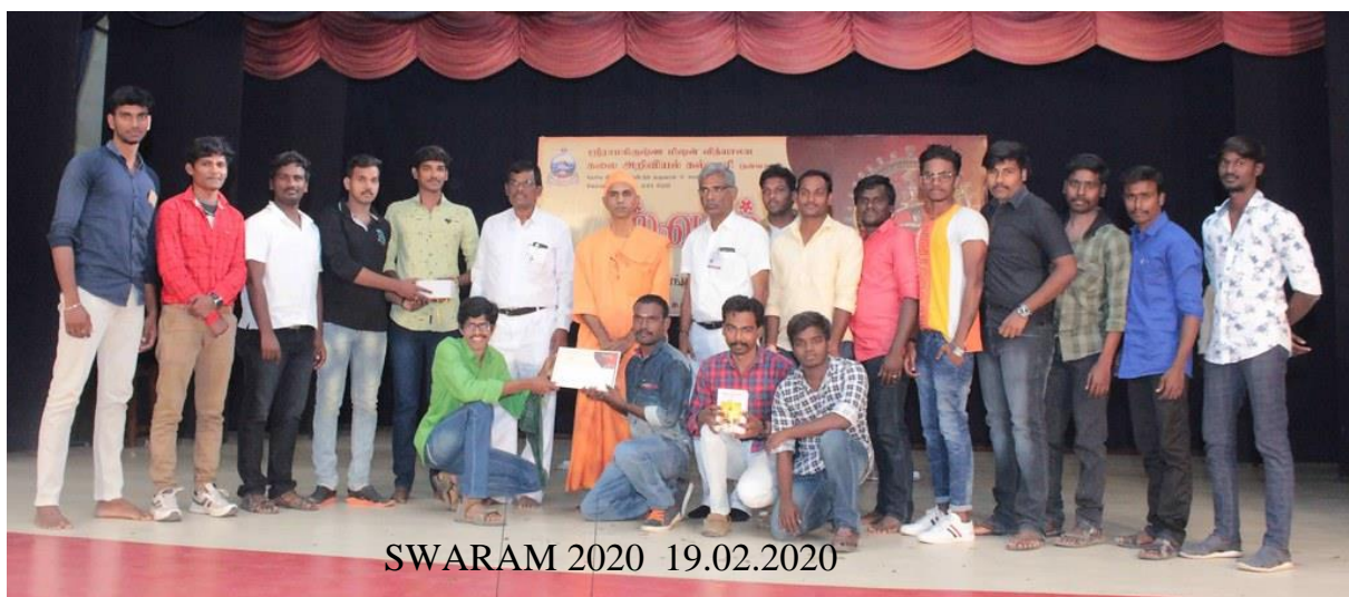
SWARAM 2020 19.02.2020