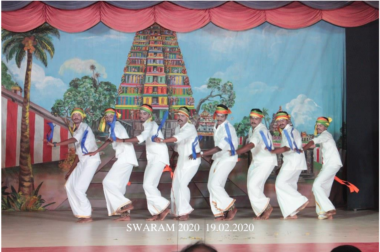
SWARAM 2020 19.02.2020