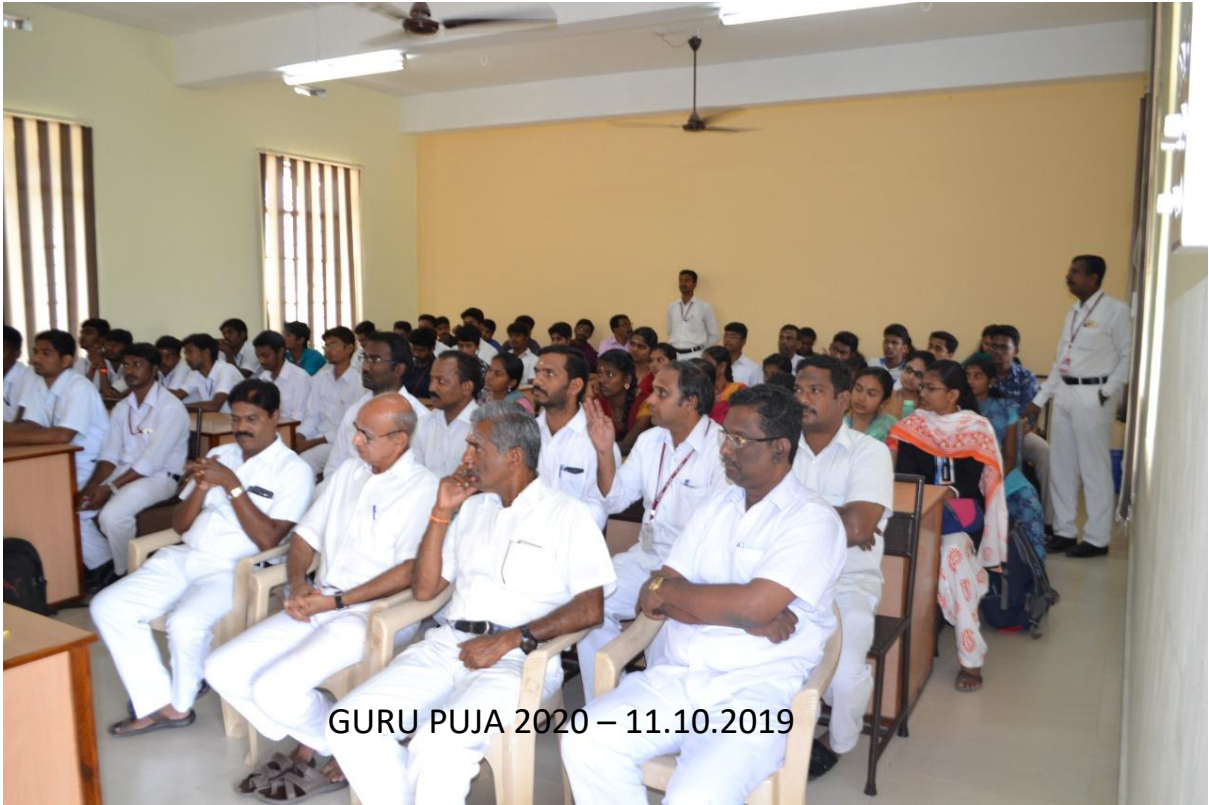
GURU PUJA 2020 – 11.10.2019