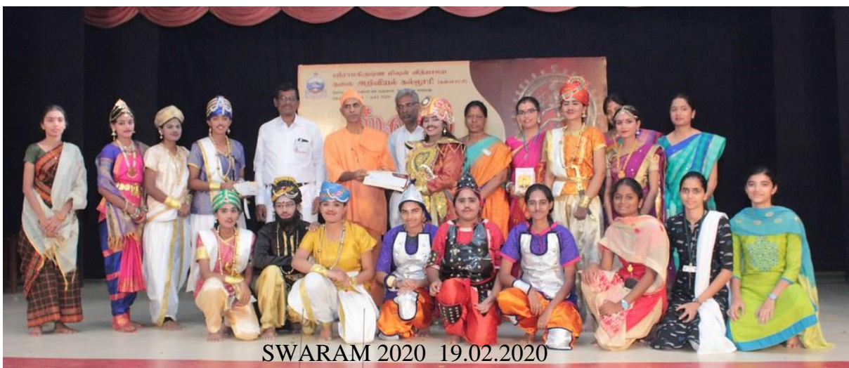
SWARAM 2020 19.02.2020