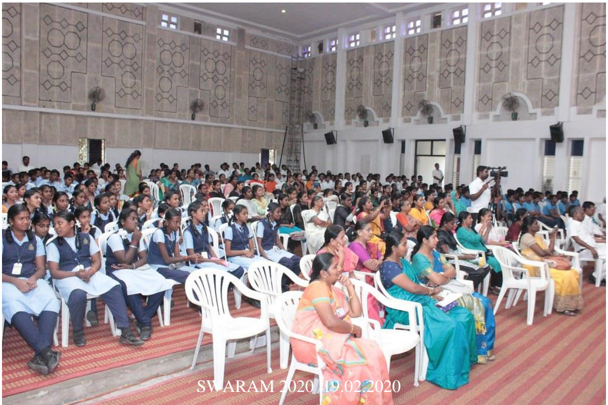
SWARAM 2020 19.02.2020