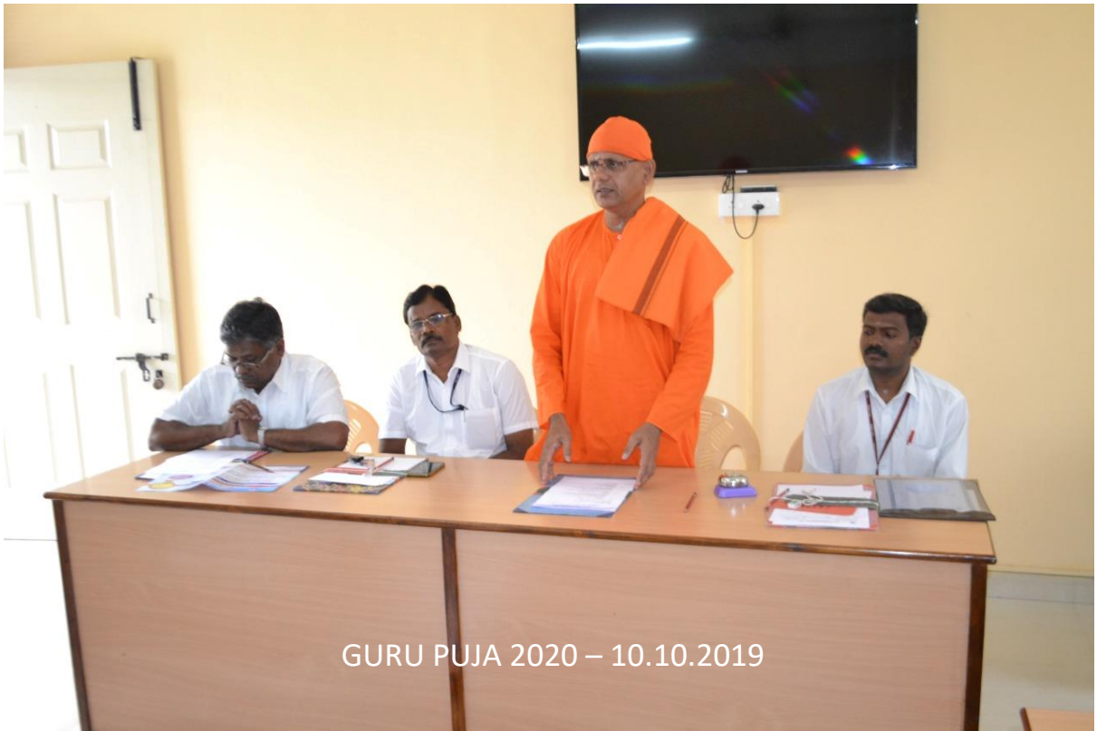
GURU PUJA 2020 – 10.10.2019