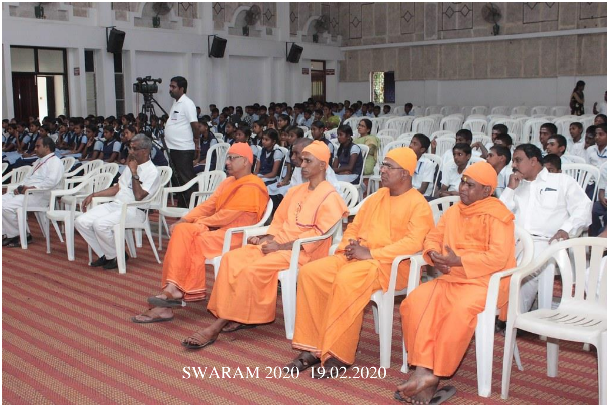
SWARAM 2020 19.02.2020