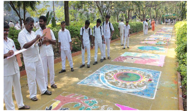
Judges ranking for Rangolis