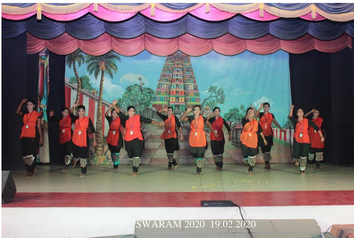
SWARAM 2020 19.02.2020