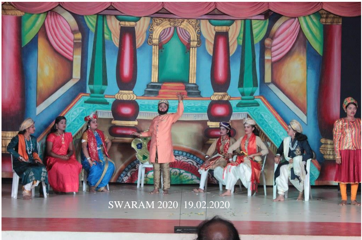
SWARAM 2020 19.02.2020