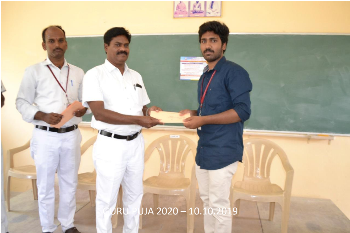
GURU PUJA 2020 – 10.10.2019