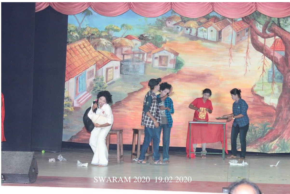
SWARAM 2020 19.02.2020