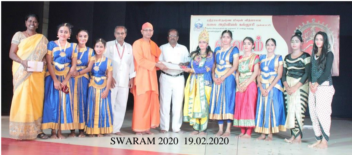
SWARAM 2020 19.02.2020