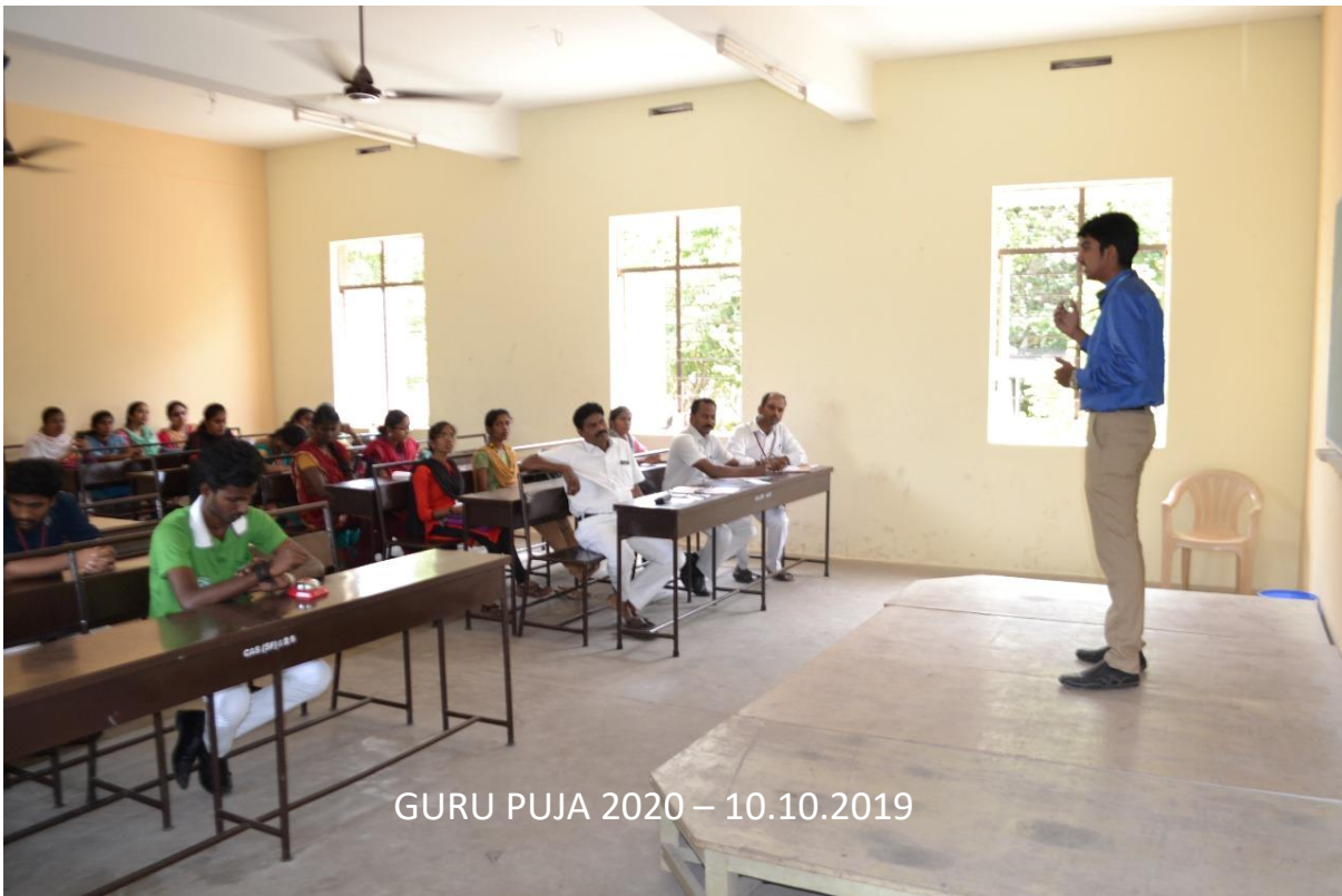
GURU PUJA 2020 – 10.10.2019